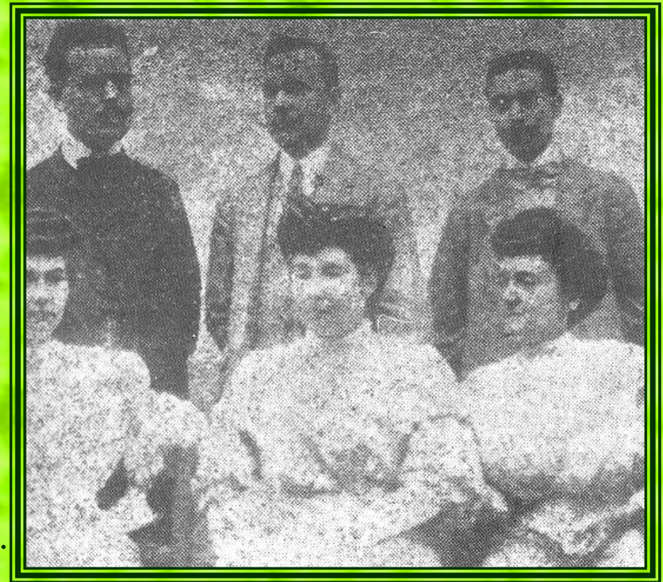
Mestres de l'escola Moderna de València.